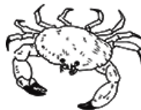
un crabe UN CRABE