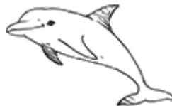
un dauphin UN DAUPHIN