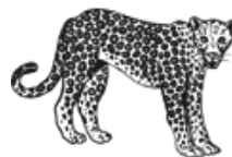
un léopard UN LEOPARD