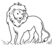
un lion UN LION