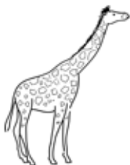
une girafe UNE GIRAFE