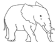
un éléphant UN ELEPHANT