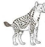
une hyène UNE HYENE